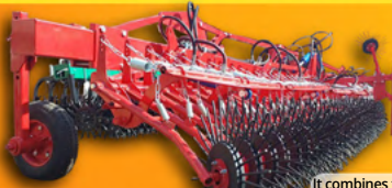
Штригельна ротаційна борона ШРБ 9 Stiegel rotary harrow ShRB 9

+38 (067) 565-90-94 www.agroprom-tpg.com