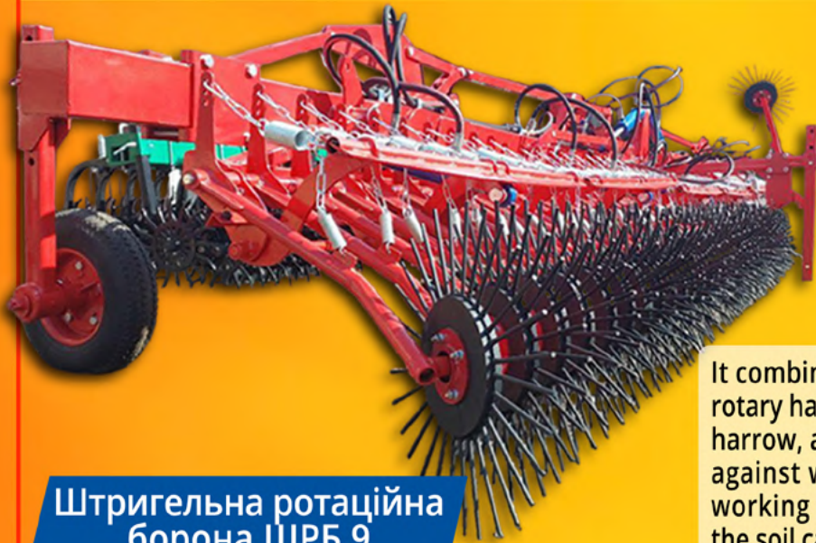
Штригельна ротаційна борона ШРБ 9